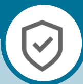
Tabla del Programa III.1. Más Seguridad para La Paz - Eje 3.- Seguridad para La Paz.